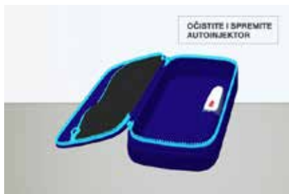
Slika 6. Na kraju, spremite uređaj u za to predviđenu kutiju.