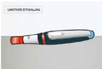
Slika 7. Nakon što je štrcaljka umetnuta i CSYNC™ autoinjektor potpuno sastavljen, spremni ste za početak primjene injekcije. Prelazimo na korak 4. u kojem ćete skinuti sivu kapicu igle.