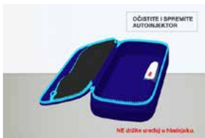
Slika 7. Uređaj se ne smije čuvati u hladnjaku.