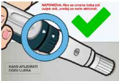
Slika 3. Važno je osigurati da je crvena traka sakrivena jer ako se još uvijek vidi, uređaj se neće aktivirati.