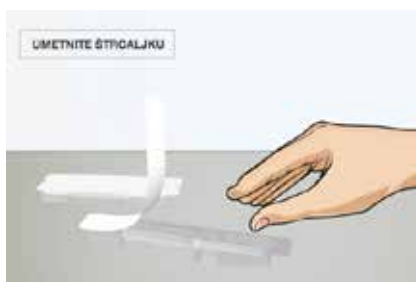
Slika 1. Za početak, izvadite štrcaljku iz pakiranja. Važno je da ne skidate kapicu igle.