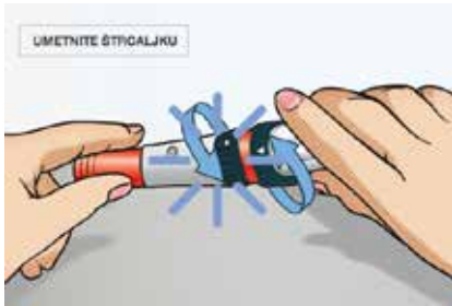
Slika 6. Pričvrstite držač štrcaljke na tijelo uređaja dok ne čujete klik i dok se bijele strelice ne poravnaju.