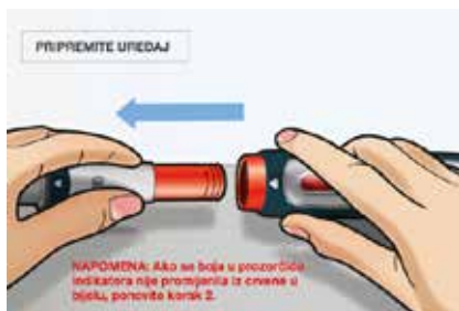
Slika 5. Važno je napomenuti da trebate ponoviti korak 2. ako se boja prozorčića indikatora nije promijenila iz crvene u bijelu. Ne prelazite na sljedeći korak ako je boja prozorčića indikatora crvena.

Nakon što je uređaj pripremljen, spremni ste za korak 3. u kojem ćete štrcaljku staviti u autoinjektor.