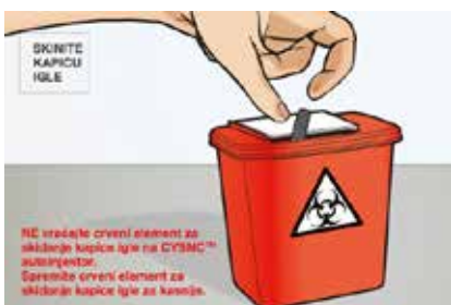
Slika 3. Važno je da ne vraćate crveni element za skidanje kapice igle na CSYNC™ autoinjektor te da ga spremite za kasnije.

Sada možemo prijeći na odjeljak 5. – kako aplicirati dozu lijeka.