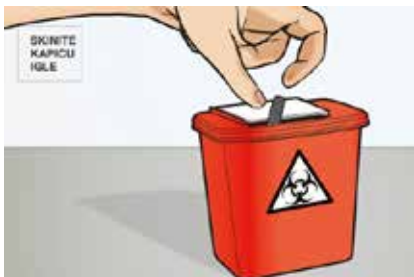
Slika 2. Odložite sivu kapicu igle u odgovarajući spremnik.