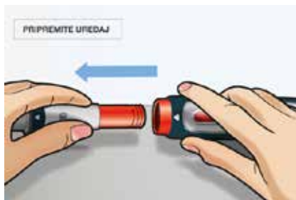
Slika 4. Izvadite držač štrcaljke iz tijela uređaja.