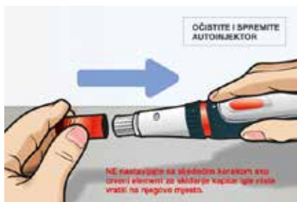
Slika 5. NE nastavljajte sa sljedećim korakom ako crveni element za skidanje kapice igle niste vratili na njegovo mjesto.