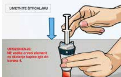
Slika 4. Važno je da do koraka 4. ne vadite crveni element za skidanje kapice igle.