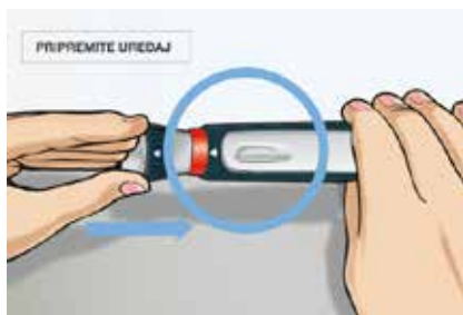
Slika 3. Gurajte držač štrcaljke u tijelo uređaja dok ne osjetite i ne čujete da je na svom mjestu. Sada možete vidjeti da se boja u prozorčiću indikatora promijenila iz crvene u bijelu.