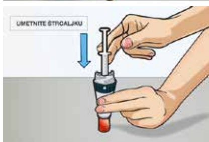
Slika 3. Za pravilno postavljanje štrcaljke, čvrsto je gurnite u držač štrcaljke pritišćući vrh štapića klipa dok se štrcaljka više ne može micati.