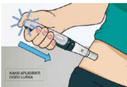
Slika 5. Držeći CSYNC™ autoinjektor u stanju pripravnosti, gurnite plavi gumb za injekciju da biste započeli primjenu injekcije. Čut ćete prvi klik nakon što počne primjena injekcije.